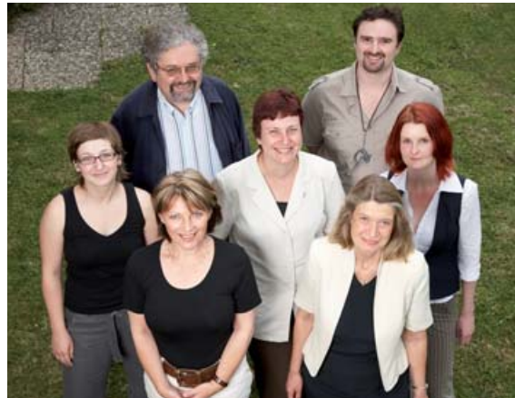
Bürodienste in Baden-Württemberg bündelt in einem Internetportal Dienstleister, die Unternehmen in der Administration entlasten.

„Bürodienste in Baden-Württemberg“ ist ein Internetportal, das Dienstleistungen in den zwölf Regionen Baden-Württembergs bündelt und übersichtlich anbietet. Unternehmen können in einer Übersichtskarte die selbstständigen Spezialisten aufrufen und sich direkt mit ihnen in Verbindung setzen. Der gemeinsame Webauftritt bietet den Mitgliedern Synergieeffekte und eine starke Präsenz auf dem Markt. Kooperationen vor Ort tragen zu mehr Kundenorientierung bei und ermöglichen den Ausbau der eigenen Angebotspalette. Bei